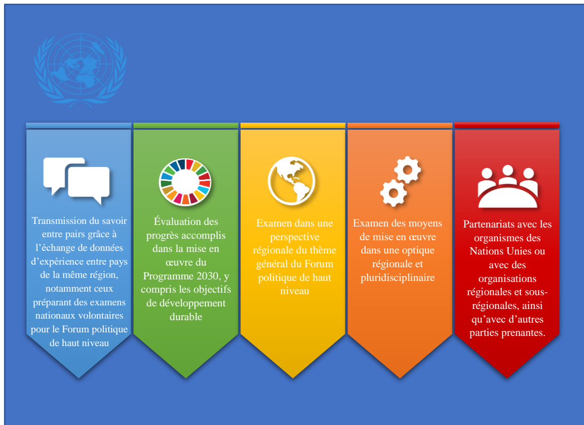
Figure I Forums régionaux pour le développement durable

4. D'autres exemples importants de plateformes intergouvernementales régionales mobilisées pour soutenir la mise en œuvre du Programme 2030 sont exposés ci-après.