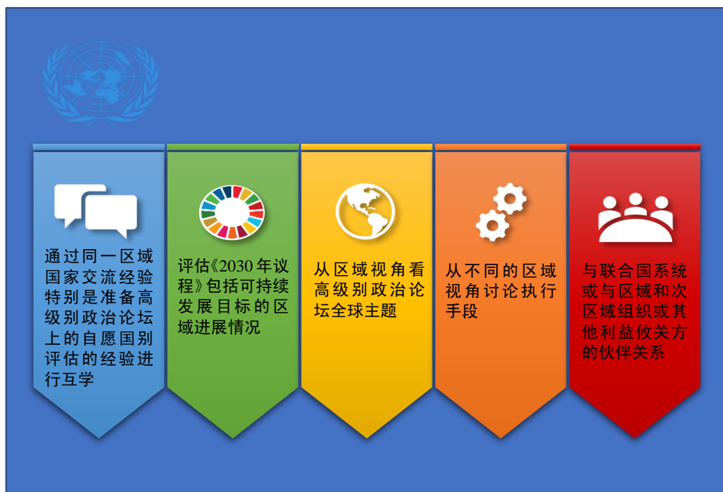
图一 可持续发展问题区域论坛